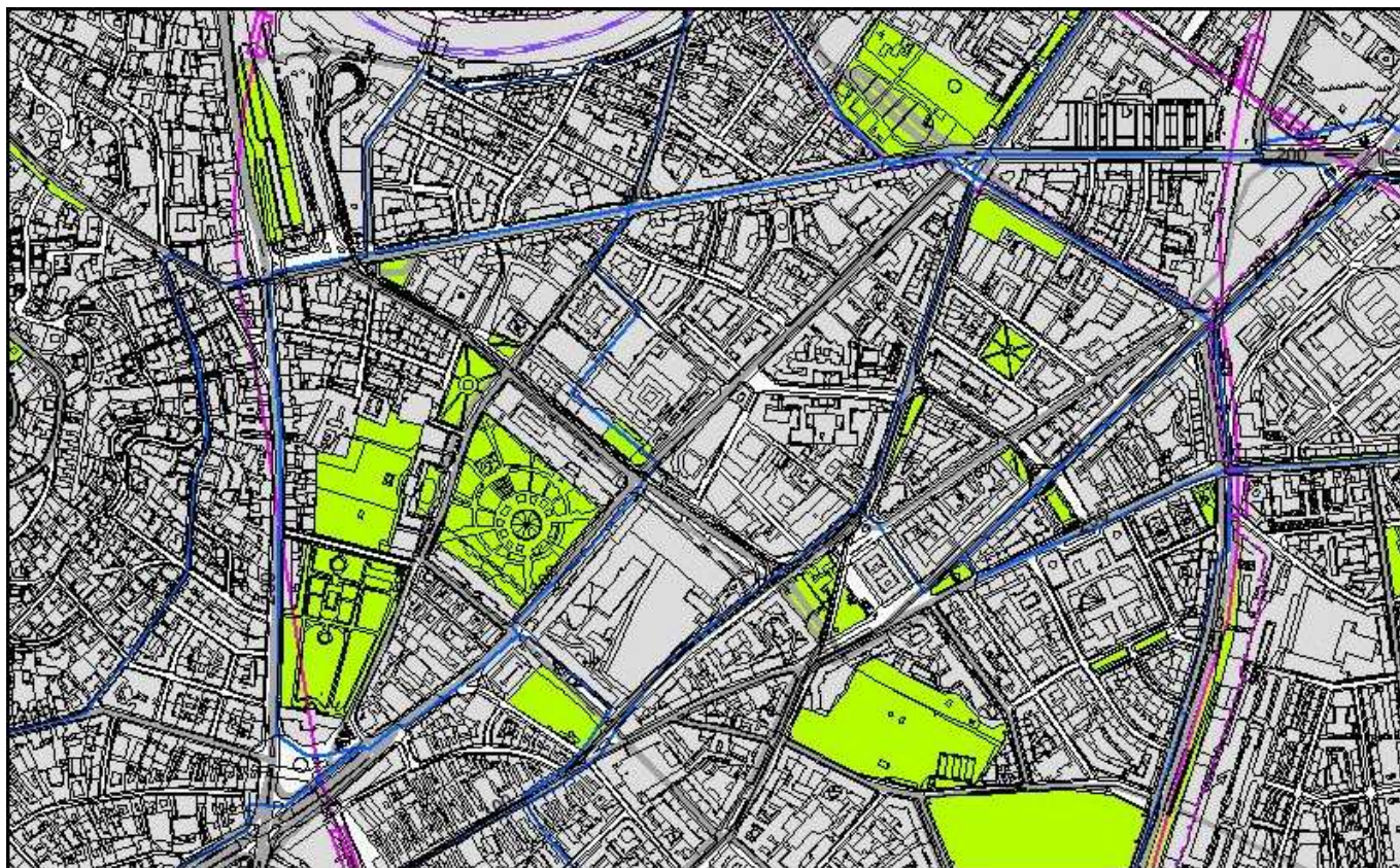
4.1. Zásobovanie vodou - zosúladienie