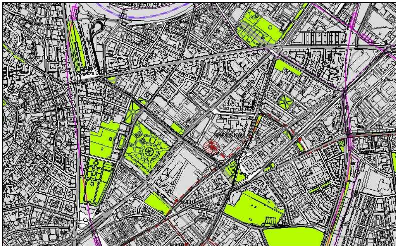
4.3. Zásobovanie elektrickou energiou - zosúladienie